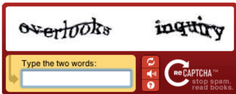
ABBILDUNG 1 ReCaptcha

Ein weiteres Beispiel für die Lösung verschiedener Problemstellungen durch Crowdsourcing stellt der Dienst ReCaptcha (VON AHN et al. 2008) dar. Bei CAPTCHAs (Completely Automated Public Turing Test To Tell Computers and Humans Apart) handelt es sich um Aufgaben, die in Web-Anwendungen zum Schutz gegen automatische Anmeldungen und andere Angriffe durch softwaregesteuerte Bots eingesetzt werden. Ein klassisches Beispiel ist die verzerrte Darstellung eines oder mehrerer Worte, die von Menschen relativ leicht, von Computern jedoch nur schwer identifiziert werden können. Der zusätzliche Nutzen von ReCaptcha liegt nun in der Tatsache, dass nicht neue Wörter generiert werden, sondern Ausschnitte aus bereits gescannten Texten, die jedoch nicht vom Computer erkannt wurden, dem Nutzer vorgelegt werden (vgl. Abb. 1). So wird einerseits gewährleistet, dass nur echte Menschen Zugang zu bestimmten Diensten erhalten, gleichzeitig wird die Digitalisierung von Büchern Wort für Wort vorangetrieben.